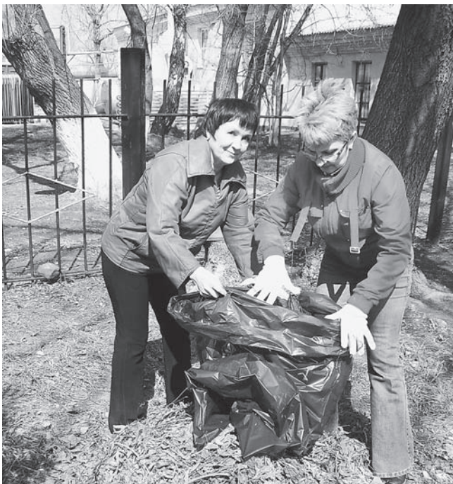
Работники отдела кадров трудятся без усталости и перерывов. Мешок за считанные минуты набивается опавшей прошлогодней листвой.