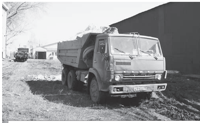
Снег с территории предприятия в этом году пришлось вывозить особенно тщательно. Как всегда, выручила заводская техника.