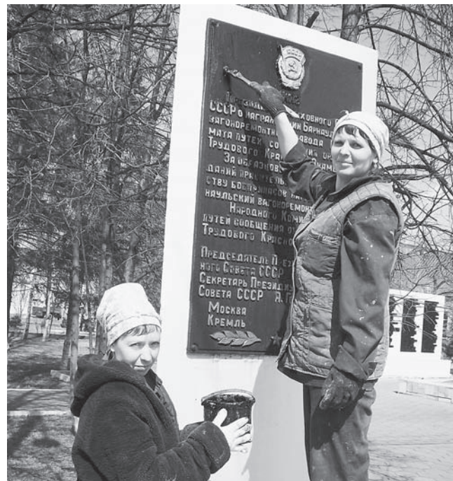
Заводской мемориал тоже необходимо было очистить и подновить после продолжительной зимы (РСУ).