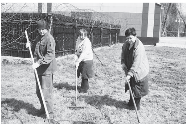
Работники АХО привычно наводят чистоту перед окнами заводских зданий.