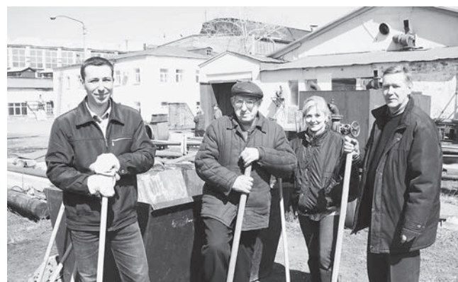
Энергетики и механики, имея общую для уборки территорию, взялись за грабли да лопаты – привычные инструменты для наведения чистоты. А еще прихватили на субботник хорошее настроение и веселые шутки – при таком раскладе успех обеспечен!