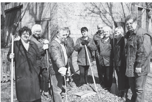
Работники ПДО – на субботнике. Вот какую кучу мусора нагребли – коллективной работе никакие объемы не страшны!

Долго мы ждали в этом году весны, и она все-таки пришла... Снег наконец-то растаял, а под ним, как всегда, обнаружился различный неприглядный мусор. Настала пора весенней уборки. Так называемый лозунг – призыв, как известно, определен историей, проверен временем и звучит привычно: «Все – на весенний субботник!».