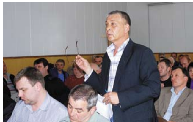
Момент встречи с трудовым коллективом.

В конце апреля состоялась моя первая встреча с трудовым коллективом, она длилась более двух часов и носила откровенный характер. Задавалось много вопросов о перспективах завода, мотивации и охране труда. Конечно, полученные ответы не могут удовлетворить всех, но коллектив должен понимать, что ситуация на заводе непростая и невозможно решить про-