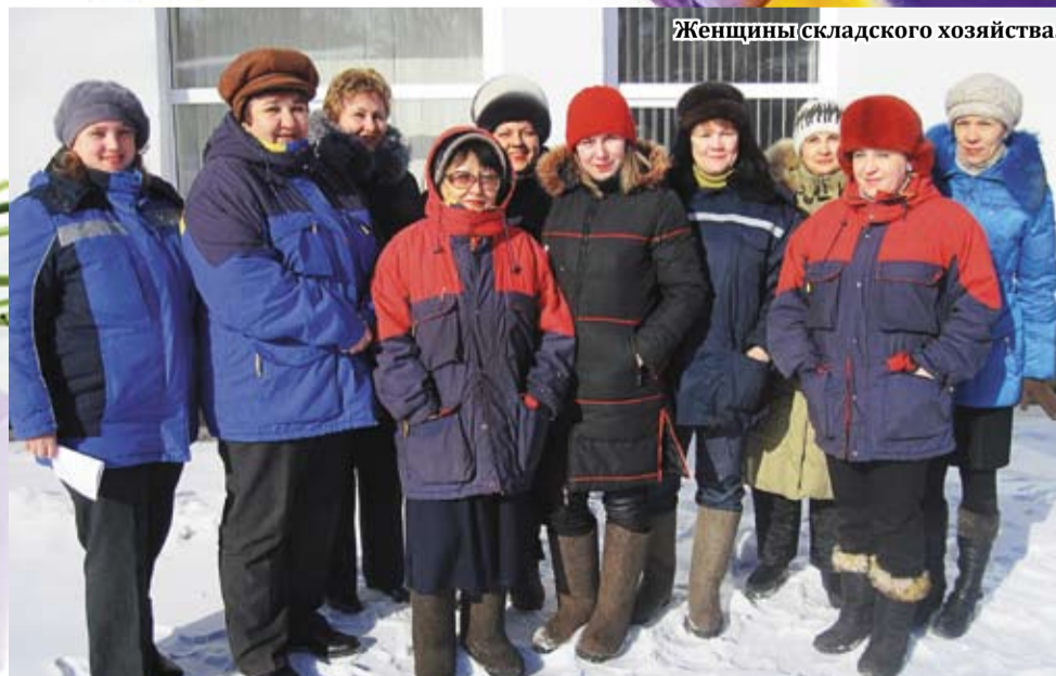
Женщины складского хозяйства.

Желаем крепкого здоровья, творческого настроения в создании новых кулинарных шедевров, счастья и благополучия.